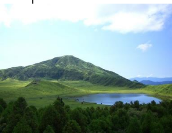
Kumamoto Prefekturasında Aso dağı

Okinava Prefekturası Kyuşunun cənubuna doğru uzanan 60 adalar qrupundan ibarətdir. Vaxtilə Ryukyu adlandırılan Okinava 17-ci əsrə kimi müstəqil krallıq olmuş və bununla əlaqədar özünəməxsus ləhcə və mədəniyyət nümunələri yaratmışdır. II Dünya müharibəsindən sonra və 1972-ci ilə kimi Okinava ABŞ hərbiçiləri tərəfindən idarə olunmuşdur. Əsas sahə turizmdir. İlboyu isti iqliminə görə su və dəniz idman növlər də çox populyardır. Okinavada öz riflərinə görə