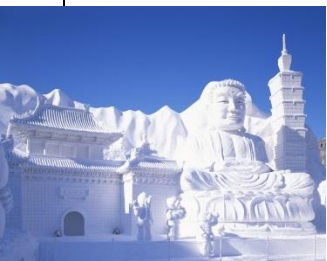
Sapporo Qar Festivalı

Kanto regionu Honşunun cənub şərq hissəsində yerləşir və Yaponiyanın ən böyük ovalığı olan Kanto Ovalığı ilə təmsil olunub. The Kanto region lies in the southeastern part of Honshu and is dominated by the Kanto Plain, Japan's largest plain. The climate is generally mild, and the four seasons are sharply delineated. This region, which includes such key cities as Tokyo, Yokohama, Kawasaki, Saitama, and Chiba, is the most populous region of Japan. The hub of the