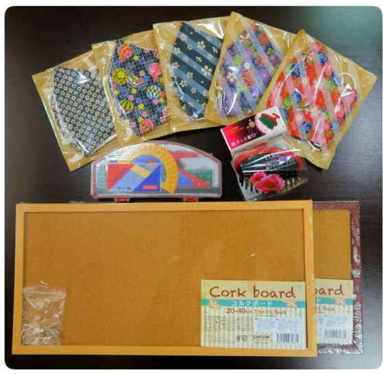
Bütün iştirakçılara təqdim olunan hədiyyələr

TEC 株式会社TECインターナショナル TEC International Co. Ltd.