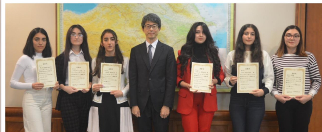
Səfir və iştirakçıların kollektiv şəkli