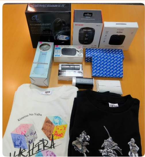
1-ci yerin sahibi və digər qaliblərə verilən hədiyyələr