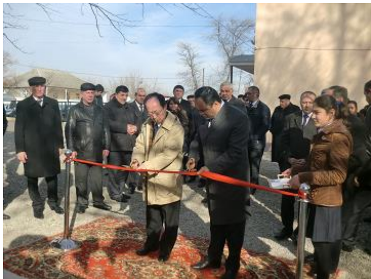
グリエフ知事とリボン・カット