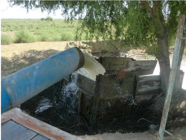
Kanala borudan su vurur